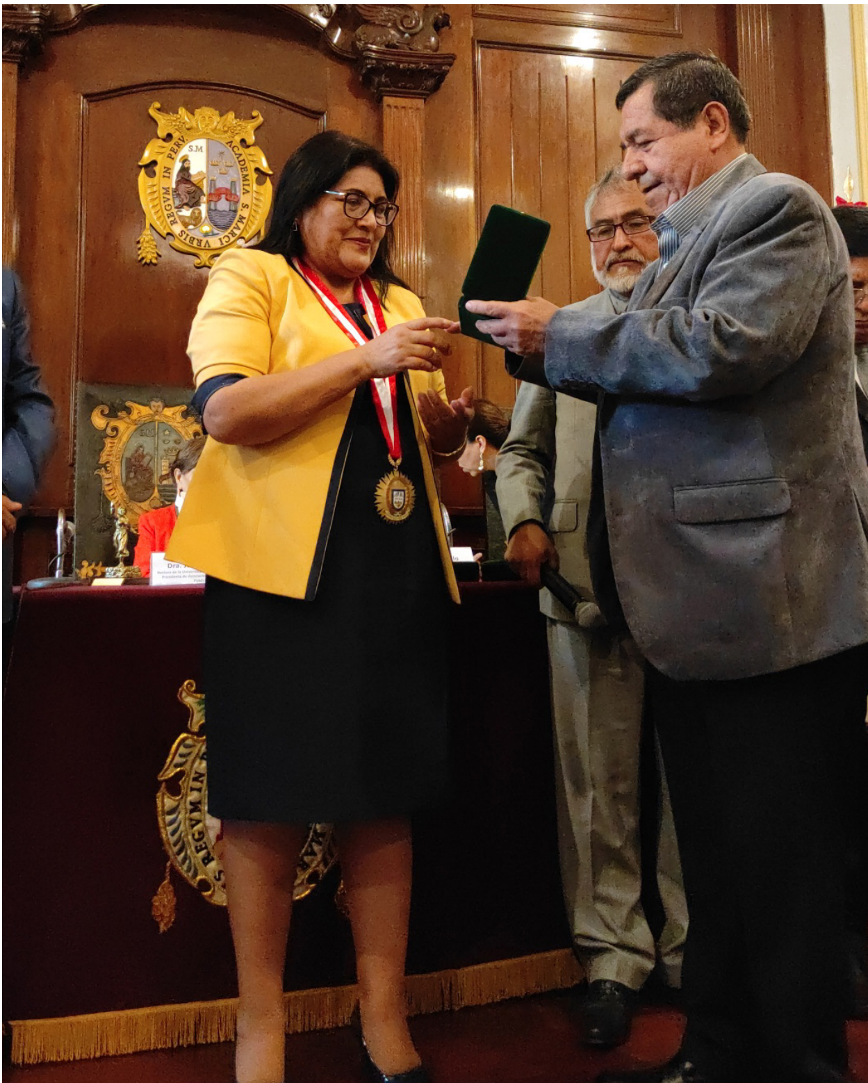
El magno evento se llevó a cabo en La Casona de San Marcos en el Cercado de Lima

La ANUPP y la ASUP destacan el importante rol que desempeñan las mujeres en la dirección académica y administrativa